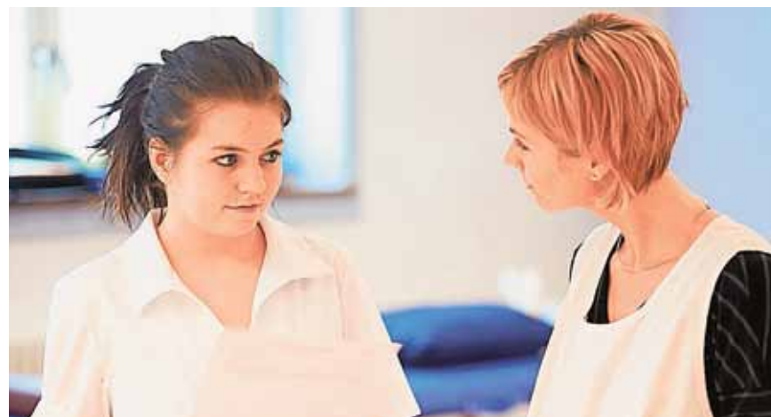
Die Ausbildung richtet sich an Frauen, die im Gesundheitswesen arbeiten möchten.

Sekretariat Klubschule Migros 8500 Frauenfeld, Telefon 052 728 05 05 www.klubschule.ch